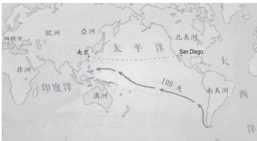
麥哲倫環球航行路線圖

他從南美洲到達菲律賓花了109天。如果鄭和從東海直接橫過太平洋到達美洲，可能不用三個月！」另一個又說：「六百多年前，如果亞洲和美洲就經由太平洋直接往來，美洲的文明將由西岸開始，歷史會如何演變呢？」同學們開始熱烈發言，老師很高興，她臨時調整了教學進度，撥出時間，讓大家討論這個話題，直到下課。