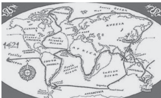
source:1421 The Year China Discovered America

有一次，他在Minnesota大學圖書館裡，觀看一張大西洋的古地圖，這張地圖是由歐洲製圖學家Pizzigano在1424年繪製的。當他看見這張地圖上有美洲時，他非常驚訝，因為